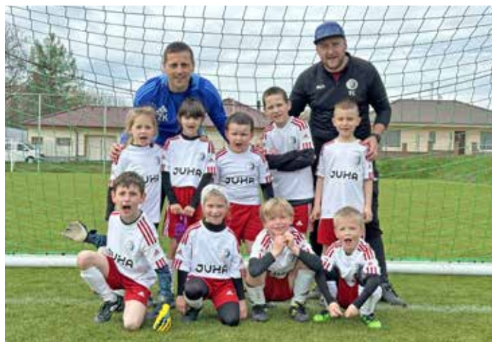
Mladší přípravek C