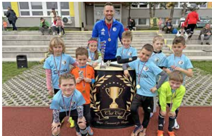
Out Cup U9 Bratislava – 1. místo