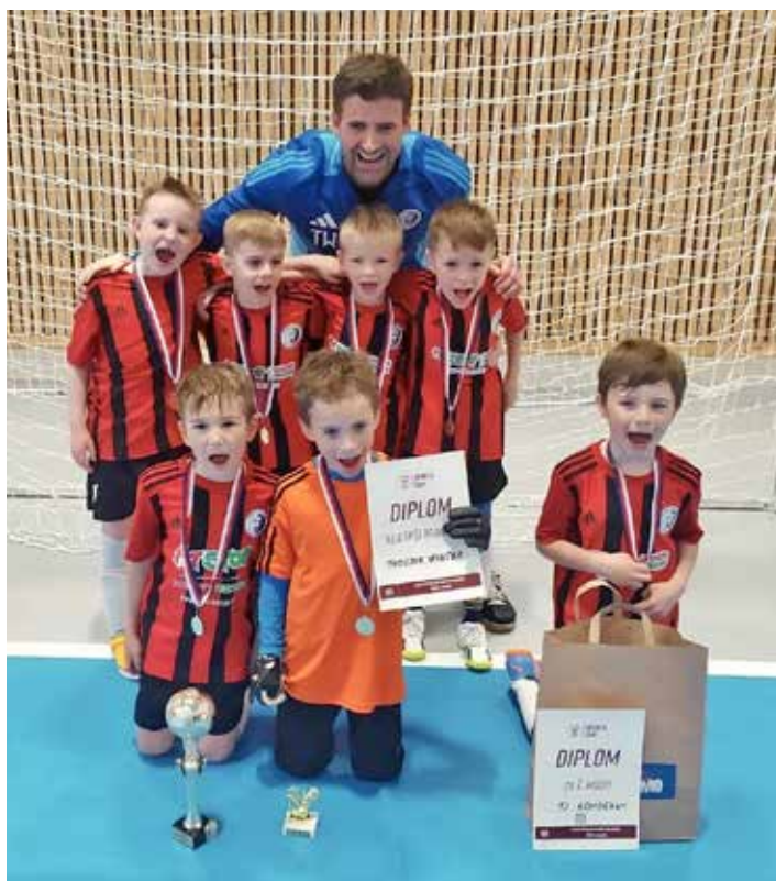
Sparta Cup Měnín U8 – 1. místo