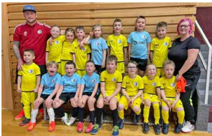
Mini přípravka turnaj Vyškov