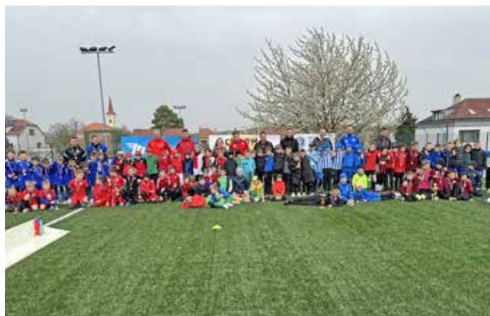
Ceroma Cup U9 Otovice