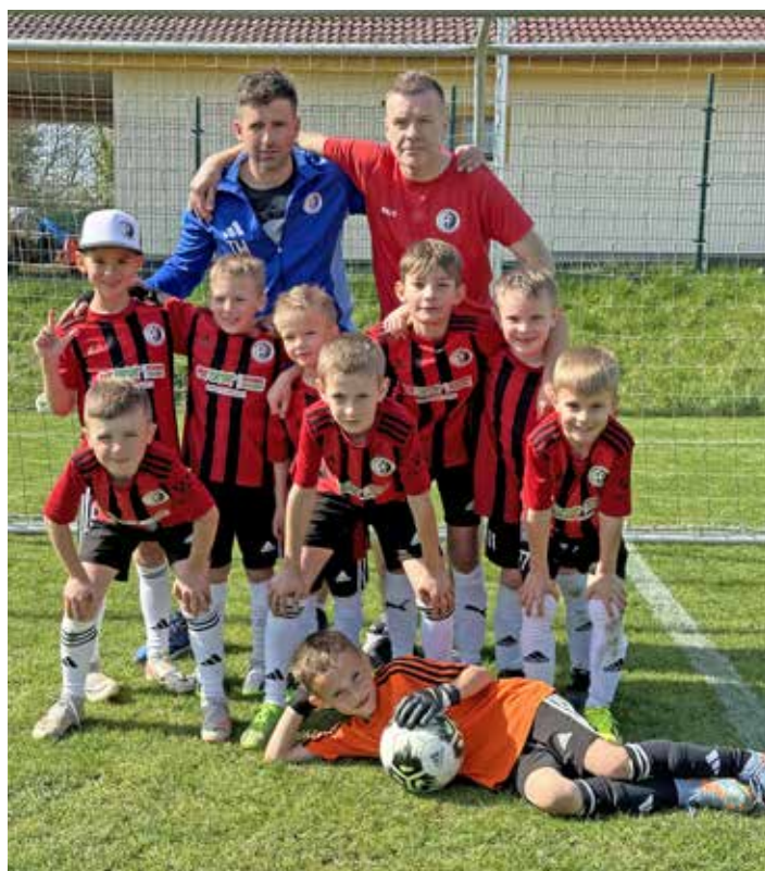
Mladší přípravek B