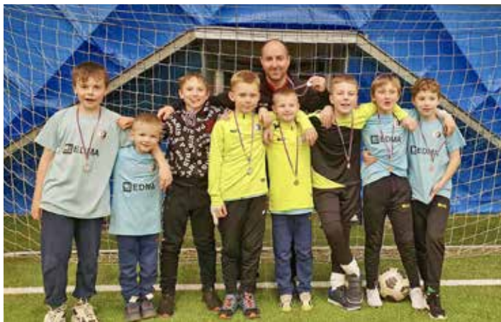
Starez Cup Brno U10 – 3. místo