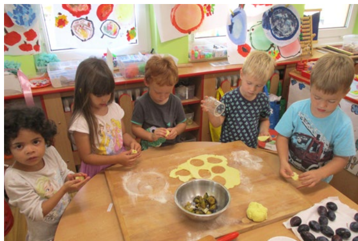
Babí léto v MŠ

Listopadem nás provázela legenda O svatém Martinovi. Motivací dětem byla dramatizace příběhu zahrnaná nejdříve paními učitelkami a poté děti dokázaly postavit kulisy, rozdělit si role, převyprávět děj doprovázený písničkou „Už Martin na bílém koni jede k nám“. Vyzkoušeli jsme si jednu ze svatomartinských tradic a to pečení rohlíčků ve tvaru podkoviček, plněných tvarohem, vyráběl se Martinův kůň, podkovy pro štěstí aj.