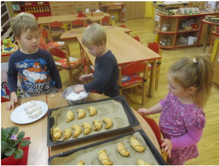
Legenda o sv. Martinovi