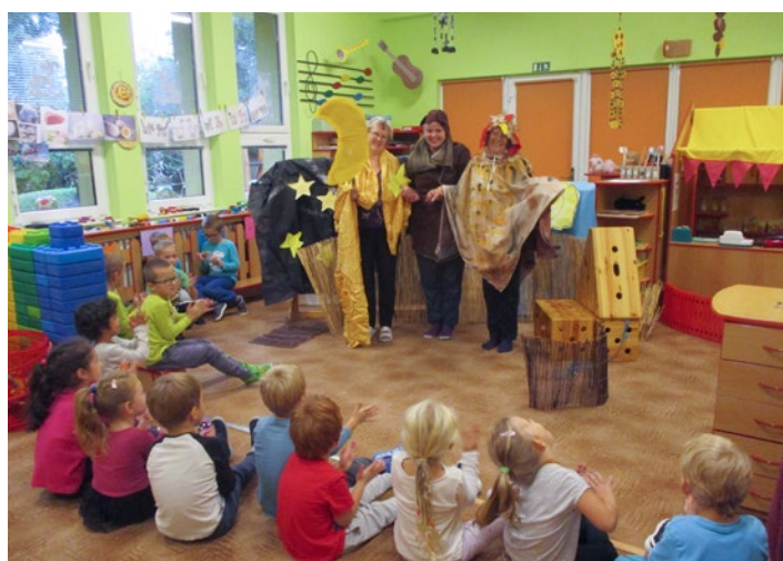
Pohádka O nespokojeném pejskovi