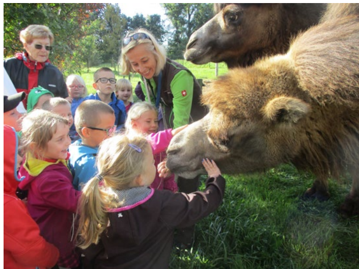
Návštěva v ZOO