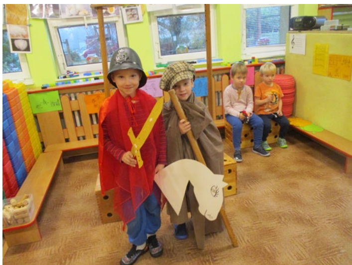
Legenda o sv. Martinovi