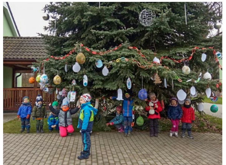
Zdobení vánočního stromu