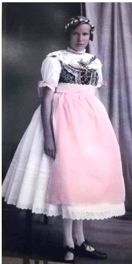
Kroj svobodné ženy