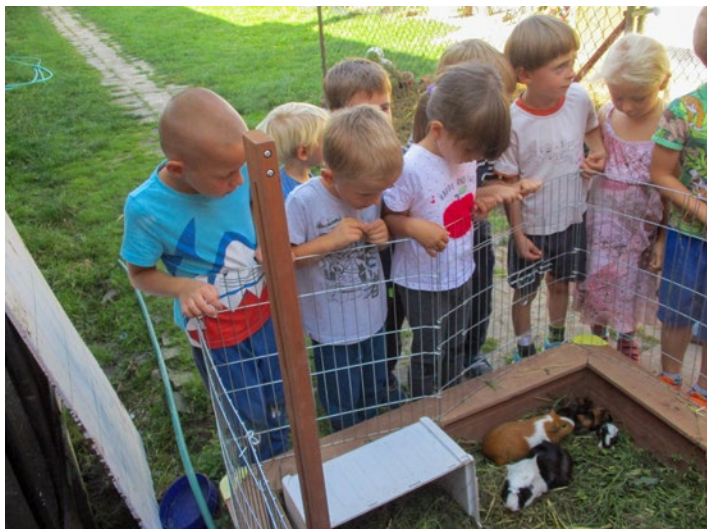
Za zvířátky u Krátkých

Pevné zdraví v roce 2021 přeje kolektiv mateřské školy Komořany