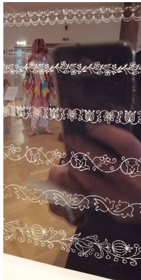
Předlohy na modrotisk