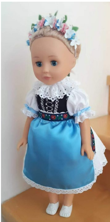
Kroj z Velešovic