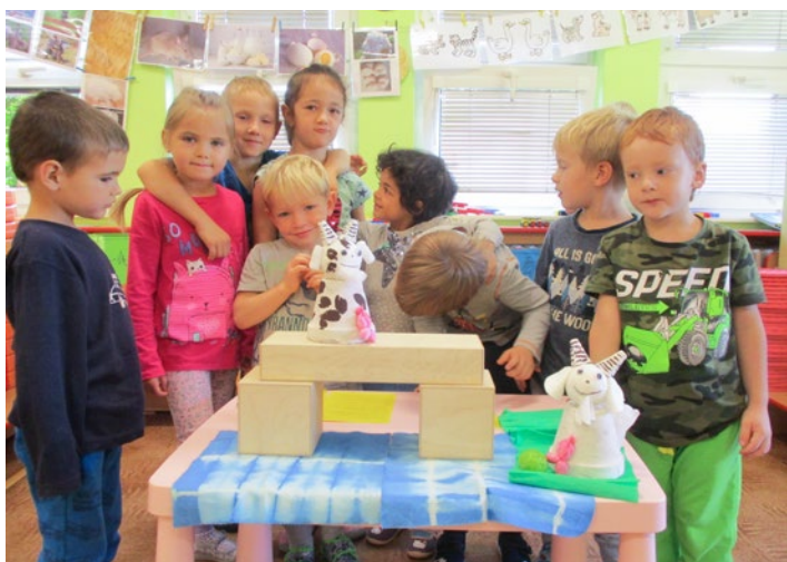
Pohádka O tvrdohlavých kozách