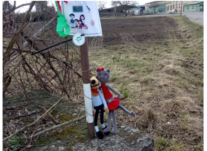
Putování pejska a kočičky