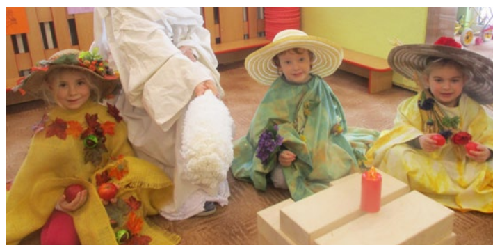
O dvanácti měsíčkách