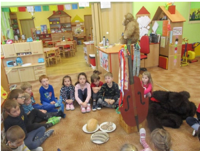
Už víme co patří k masopustu