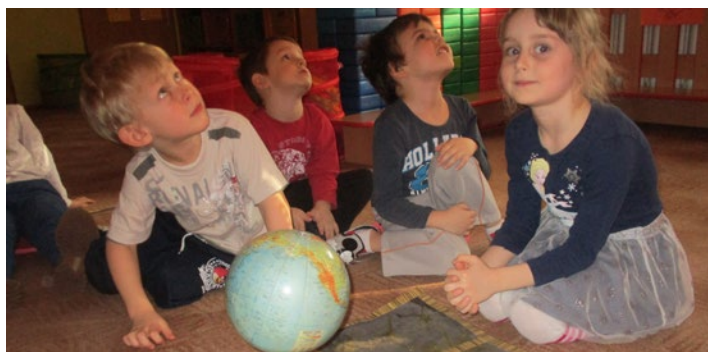
Pozorujeme střídání dne a noci

Na zahradě školky vyrostlo iglú, které děti společně vyrobily. Každý pobyt venku provázal výskot, koulovačky, bobování, děláni andělů ve sněhu - prostě radost.