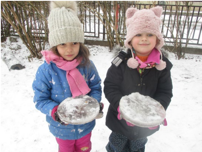
Vyrábíme ledové ozdoby