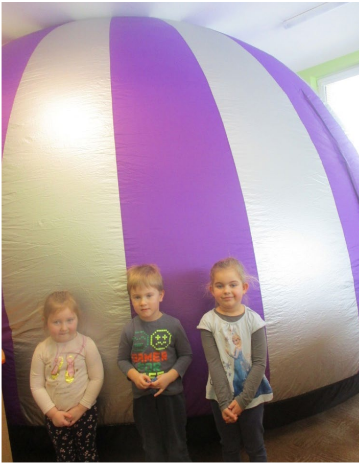
Sférické kino v MŠ